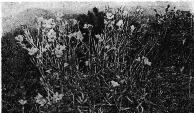
Мал. 4. Білотка кримська, або ясколка Біберштейна, в горах Криму.

Херсонської області; зберігається невелика ділянка цілинного степу в Асканії-Нова Чаплинського району Херсонської області. В Криму охорона природи представлена Кримським заповідно-мисливським господарством (кол. Кримський заповідник).