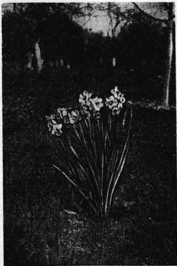
Мал. 3. Нарцис вузьколистий в Закарпатті.

Клен Стевена ( Acer stevenii A. Р o j a r k). Він росте в гірських лісах Криму.