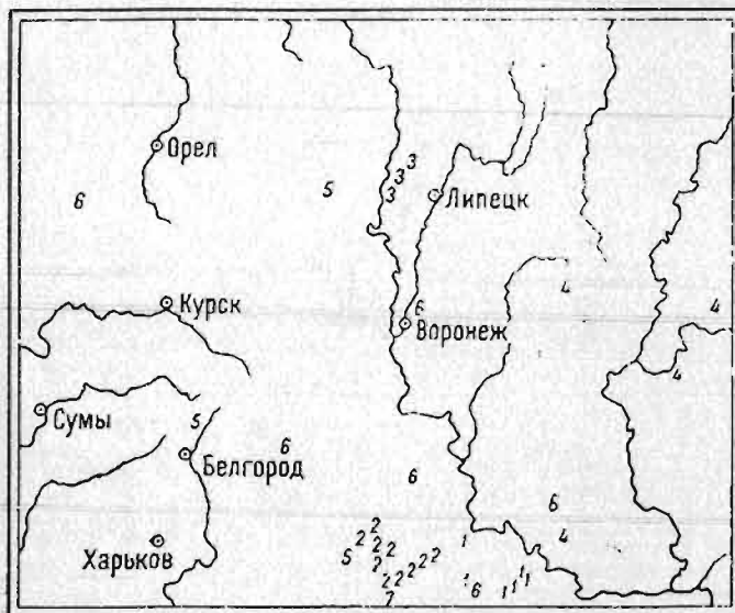
Рис. 4. Местонахождения флористических новинок области «Флоры Маевского» издания 1954 г., а также Восточной Украины, по данным Гербария заповедника «Галичья Гора». Схема II.

1 — Alyssum gymnopodium P. Smirn.; 2 — Andropogon ischaemum L.; 3 — Aneurolepidium angustum (Trin.) Nevski; 4 — Betula litwinowii A. Doluch.; 5 — Rosa caryophyllacea Bess.; 6 — R. coriifolia Fries; 7 — Thymus caicareus Klok. et Schost.; 8 — T. dimorphus Klok. et Schost.