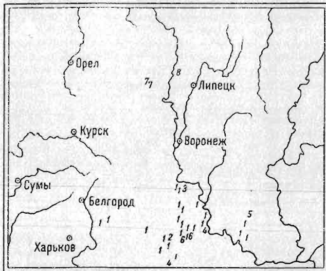
Рис. 3. Местонахождения флористических новинок области «Флоры Маевского» издания 1954 г., а также Восточной Украины, по данным Гербария заповедника «Галичья Гора». Схема I.

1 — Alyssum gymnopodium P. Smirn.; 2 — Andropogon ischaemum L.; 3 — Aneurolepidium angustum (Trin.) Nevski; 4 — Betula litwinowii A. Doluch.; 5 — Rosa caryophyllacea Bess.; 6 — R. coriifolia Fries; 7 — Thymus caicareus Klok. et Schost.; 8 — T. dimorphus Klok. et Schost.